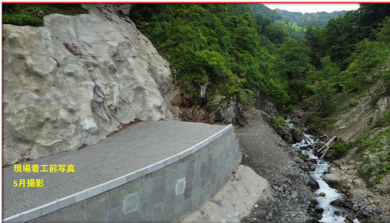
現場着工前写真 5月撮影