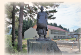
清川関所跡・芭蕉像

清川関所跡は日本遺産「自然と信仰が息づく『生まれかわりの旅』」の構成文化財です。