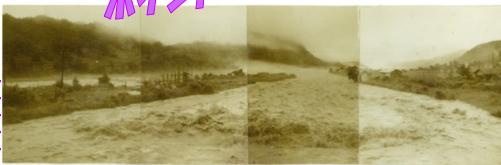
【洪水・土砂災害の軽減】

昔暴れ川だった立谷沢川が、建設されたこと によって、洪水・土砂災害が軽減されています。