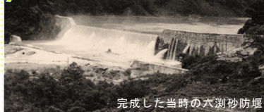
完成した当時の六瀨砂防堰