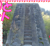
上の部分は 倉甲積みの デザインです