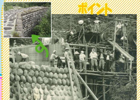
【玉石コンクリート造り砂防堰堤】