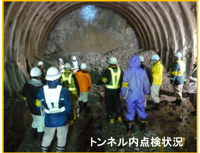
トンネル内点検状況

今回は、発注者10名、受注者19名の合計29名が参加し、他の工事現場でも取り入れるべき良い点や、事故が起こらないよう改善すべき点がないか点検を行い、検討会において意見交換を行いました。