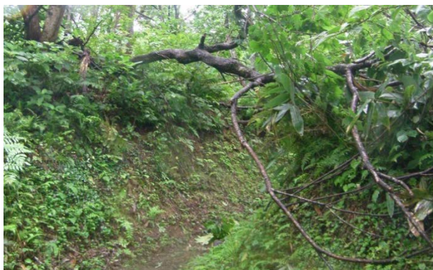
工事現場へ通じる通路上の倒木