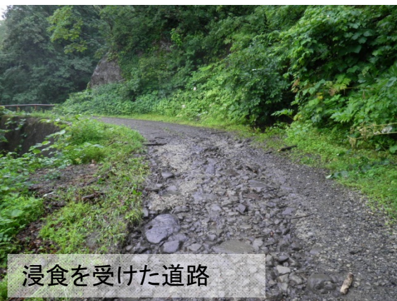
浸食を受けた道路