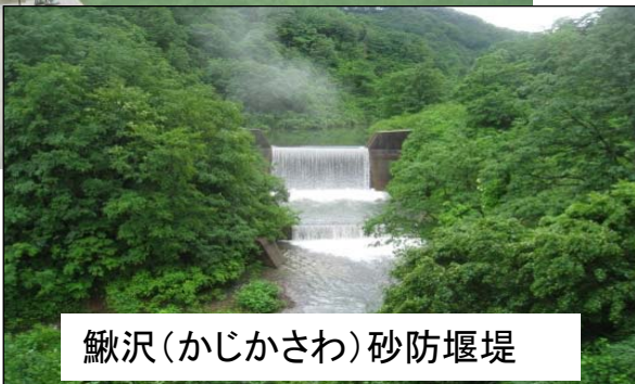
鰻沢(かじかさわ)砂防堰堤