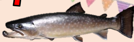
↑大鳥池に棲むといわれる伝説の魚タキタロウ

令和元年5月26日(日)鶴岡市大鳥でタキタロウまつりが開催されました。赤川砂防出張所では砂防事業に関するパネル展示、土砂災害と地すべりの模型実験を行いました。工業者(チームこどももるたい)による高所作業車の乗車体験では約360の方が体験しました。