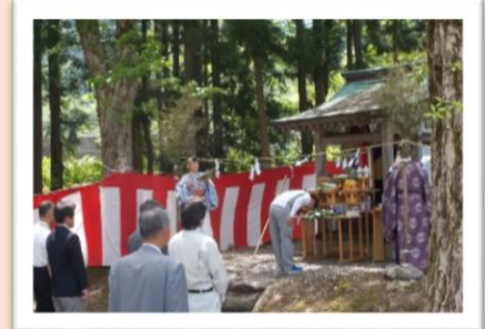
朝日連峰大鳥登山口 安全祈願祭の様子

イベントでは魚のつかみ取りなどの催しや地元特産品の屋台村で大変賑わっていました！ 大鳥川や荒沢ダムの湖畔ではカヤックやカヌーを楽しむ方の姿も見られました。