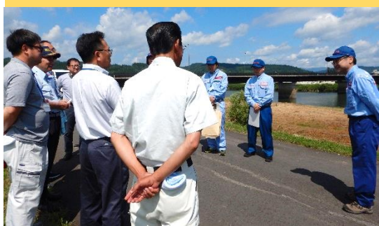
↓ 堰堤の構造や災害時の効果を説明