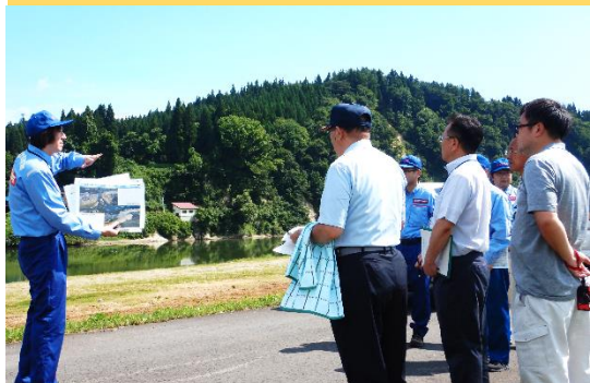
↓ 堤防整備や河道掘削の効果の説明