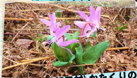
村花: (旧朝日村) かたくりの花

● HPアドレス http://www.thr.mlit.go.jp/shinjyou/ ● 公式X(旧Twitter) もぜひご覧ください。『新庄河川』で検索！ ご覧いただいたご意見、ご感想をお寄せ下さい