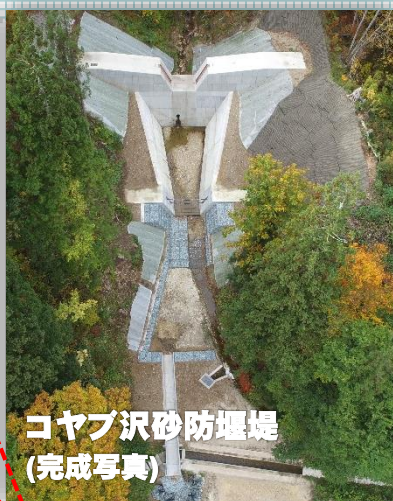
コヤブ沢砂防堰堤 (完成写真)