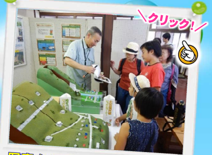
写真をクリックすると、詳しい内容をご覧いただけます!

国土交通省では、毎年7月21日～31日を「森と湖に親しむ旬間」とし全国のダム等において様々なイベントを行っています。西川町にある月山湖(寒河江ダム)では、7月29日(日)月山湖夏まつりが行われました。当出張所では、「土砂災害パネル展示」のほか、「模型実験コーナー」「ぬりえコーナー」を設置しました。イベント当日は多くの親子連れで賑わい、各コーナーとも大盛況となりました。