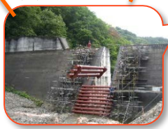
風吹沢第3砂防堰堤 設置のようす