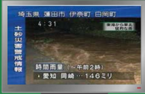
テレビでの表示例

土砂災害警戒情報は、降雨による土砂災害の危険が高まった時に、都道府県と気象庁が共同で発表している防災情報です。土砂災害警戒情報が発表されたら、市町村が発表する避難勧告等に注意し、いつでも行動できるよう心構えをしましょう。危険を感じたら、自主的に避難することも重要です。