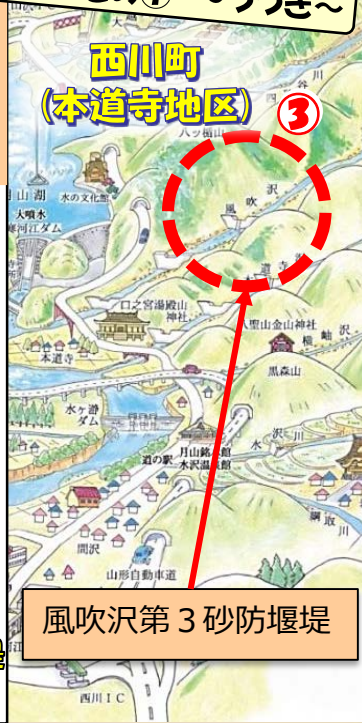
風吹沢第3砂防堰堤