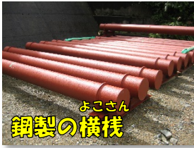
よこさん 鋼製の横棧

施工箇所は3堰堤になりますが、いずれの河川も大変水がきれい夏場はマイナスイオンが大量に注がれ、熱中症対策にもなりました。いましばらくの間続きますが、地域の皆様のご支援ご協力賜りながら、無事故で完成となるよう努力してまいります。