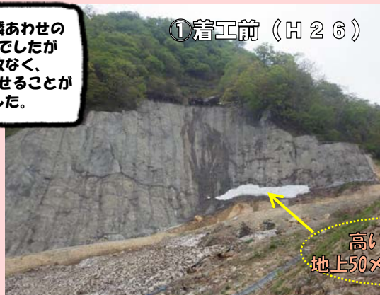
① 着工前 (H 2 6)