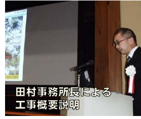
田村事務所長による 工事概要説明

肘折地区として経験したことの無い災害だった。対策の完成は肘折地区の安全安心が確保されると安堵している。