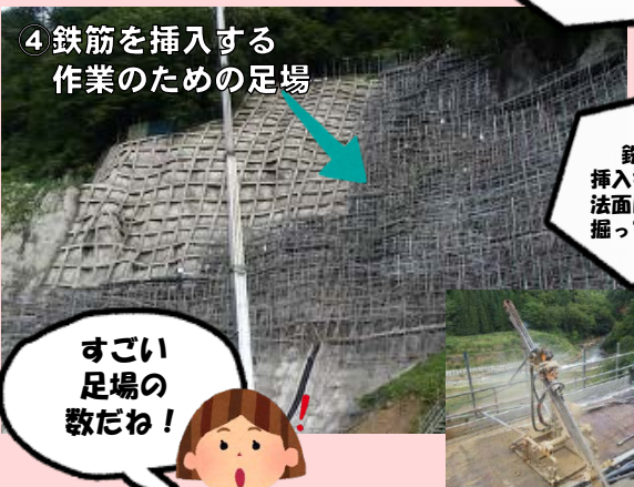
④ 鉄筋を挿入する 作業のための足場