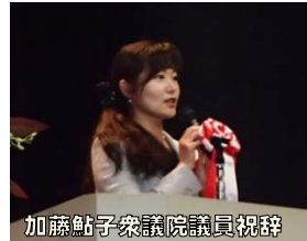
加藤鮎子衆議院議員祝辞