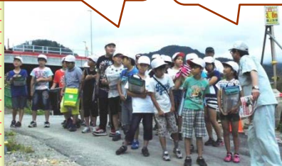
みんな、疑問に思ったことを聞いていました！