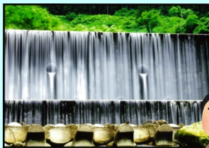
昨年度の作品 (↑) 柳瀬砂防堰堤 (←) 大越第二砂防堰堤 (寒河江川流域)