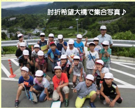
肘折希望大橋で集合写真♪

普段は入れない現場で地すべりについて質問したり、真剣に話を聞いて、勉強していました。