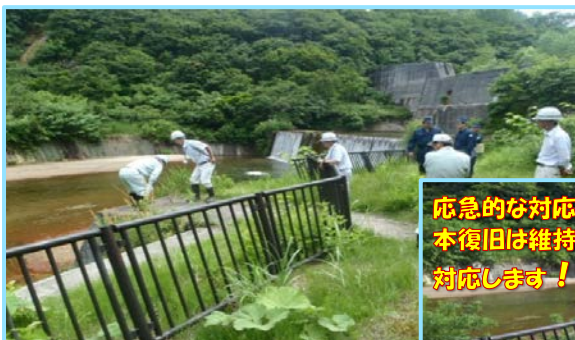
苦水第一砂防えん堤

6月23日、新庄警察署(清水・肘折駐在所)・大蔵村役場・当出張所合同で、大蔵村内の砂防施設の点検を行いました。この合同点検は、河川やダムの利用が多くなる夏休み前に、安心してこれらの施設を利用させていただくために実施しているものです。点検箇所は、苦水第一砂防えん堤・苦水河川公園・肘折砂防えん堤・豊牧排水トンネル・上竹野床固工の5ヶ所です。