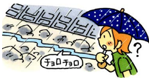
雨が降っているのに 川や沢の水が減っている

必ずしも前触れがあるとは限りませんが、前触れを発見した場合はできるだけ早く安全な場所に避難してください。