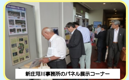
新庄河川事務所のパネル展示コーナー