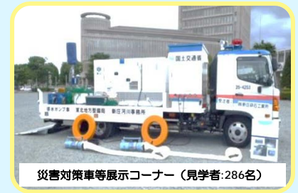
災害対策車等展示コーナー（見学者:286名）