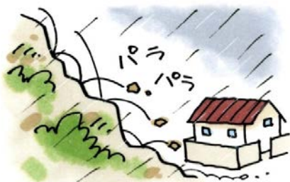
小石が落ちてくる