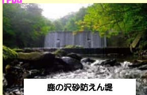
鹿の沢砂防えん堤