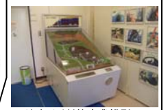
▲地すべり対策事業模型