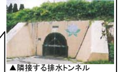
▲隣接する排水トンネル