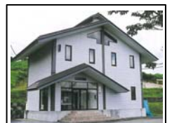
▲豊牧地すべり資料館