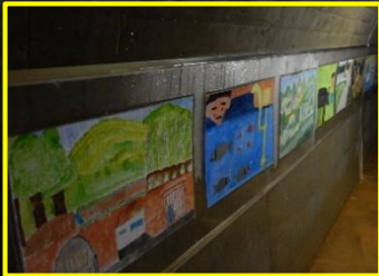
入口付近には沼の台小学校皆さんの図画が飾られています