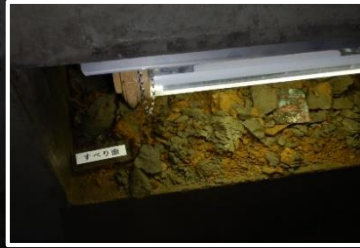
少し進むと左側にすべり面がありました