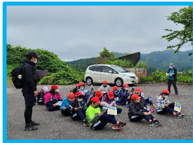
↑ 皆さん集中して資料を読んでいます ↓