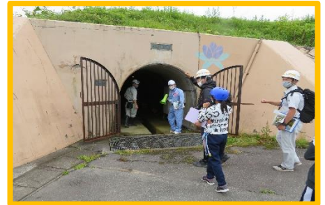
↑ いざー！トンネルの中 ↓