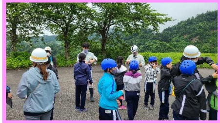
↑ ヘルメットのおご紐に苦戦中 ↓