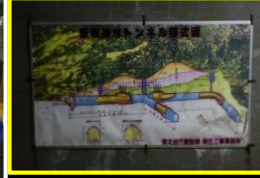
豊牧排水トンネル模式図