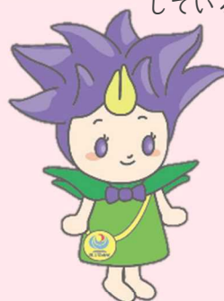
リーンどん (H30頃～登場)