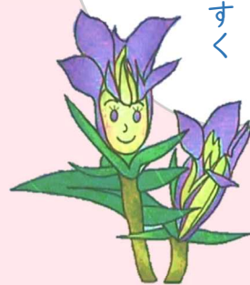
初代 リーンどん (H14頃～登場)