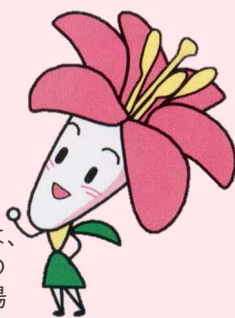
ヒメサユリ (H4頃～登場)