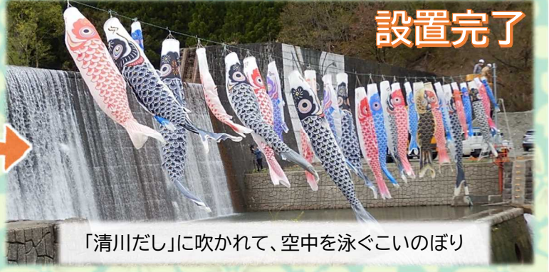
「清川だし」に吹かれて、空中を泳ぐこいのぼり