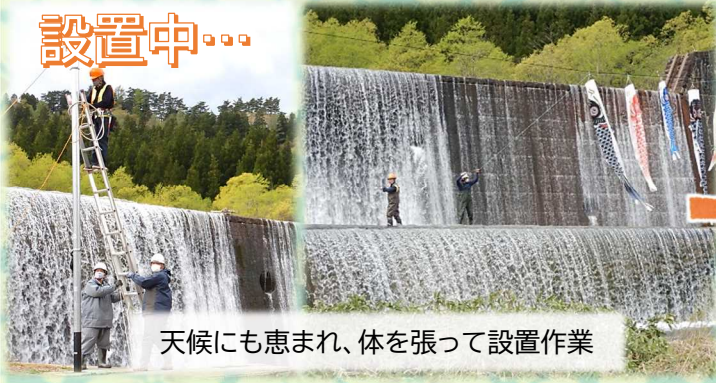
天候にも恵まれ、体を張って設置作業