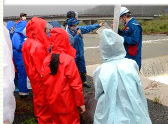
科沢地区の流路工