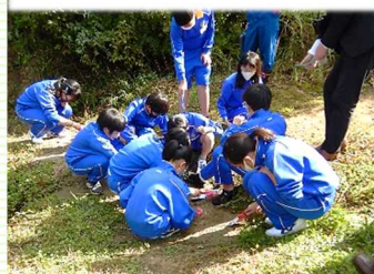
科沢地区の化石採取