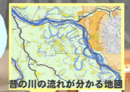
昔の川の流れが分かる地図