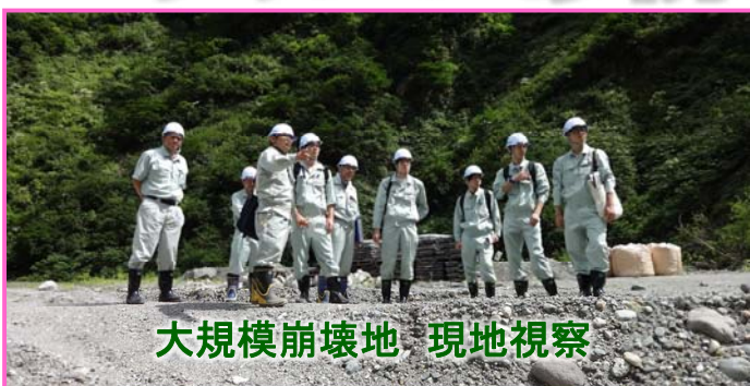
大規模崩壊地 現地視察