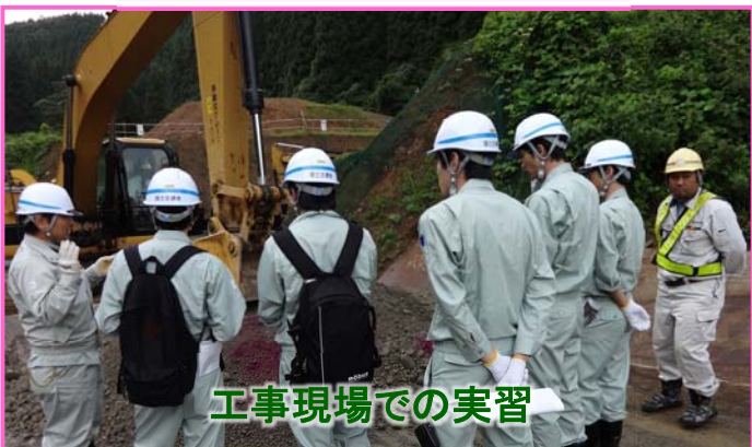
工事現場での実習