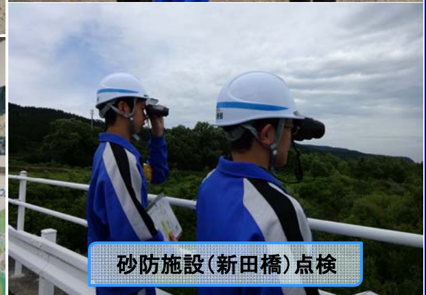
砂防施設(新田橋)点検

職場体験学習とは、進路学習の一環として、職種の役割や働くことの厳しさ大変さと共に、働くことの喜び充実感を味わい、将来の職業選択に役立てる事を目的として実施しています。今年も余目中の生徒2名が職場体験学習に訪れ、色々な学習メニューを通して当出張所の業務に携わりました。今回、初めて砂防施設等を点検し、砂防施設が生活の中で安全な暮らしを守るとても重要な役割を果たしている事などを学ぶことができ、とても充実した2日間になったという感想をいただきました。