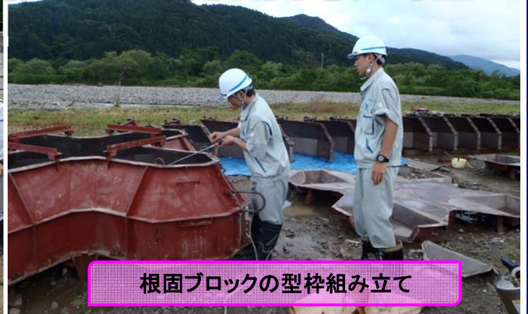
根固ブロックの型枠組み立て

インターンシップ(就業体験学習)とは、学生の就業意識の啓発、国土交通行政への理解を深めてもらうことを目的とし実施しています。生徒2名が東大沢砂防堰堤工事現場においては測量を、溪流保全工事現場においては根固ブロックの型枠組み立て等の実習を行いました。