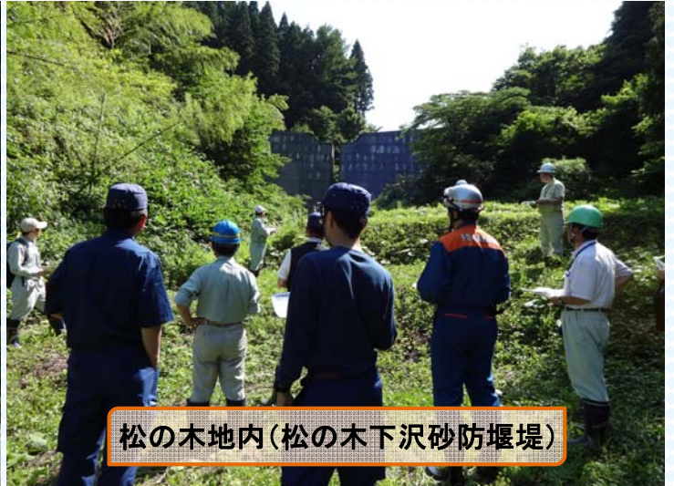
松の木地内(松の木下沢砂防堰堤)

庄内町・山形県庄内総合支庁・警察署・消防本部・消防団・当出張所が合同で地すべり危険箇所の現地調査を行いました。点検終了後、庄内町役場において点検結果の報告や防災に係る意見交換を行いました。