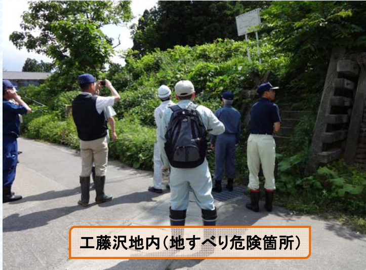
工藤沢地内(地すべり危険箇所)