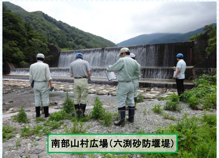
南部山村広場(六淵砂防堰堤)

夏休みを間近にひかえた7月8日に、庄内町・山形県庄内総合支庁・当出張所が合同で立谷沢川流域の公園や広場を安全に利用していただくために点検をおこないました。点検結果をふまえ、安全に利用いただけるように、看板等を設置いたしました。