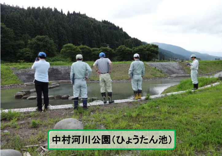
中村河川公園(ひょうたん池)