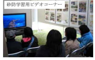
砂防学習用ビデオコーナー