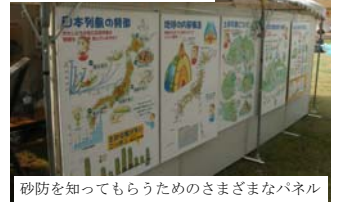
砂防を知ってもらうためのさまざまなパネル