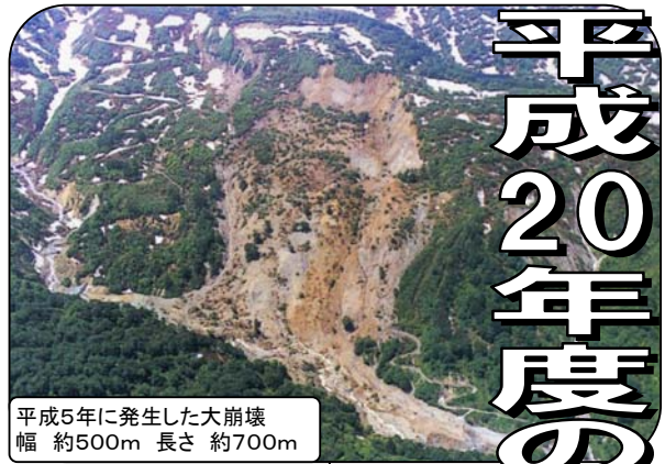
平成5年に発生した大崩壊 幅 約500m 長さ 約700m

◇板敷川は、昨年度えん堤が完成し、今年度は下流の護岸と上流の付替道路を施工します。