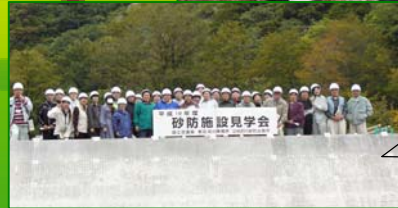
平成19年度『板敷川砂防えん堤工事』の見学風景