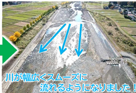
令和3年11月(施工完了)

木ノ沢地区の河道掘削と護床ブロックの補修が完了致しました。雨による水位上昇で作業の中止も何回か有りましたが、地域の皆様のご協力により無事に工事を完了することが出来ました。