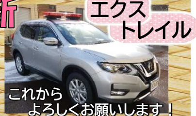
これから よろしくお願いします！