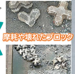
摩耗や壊れたブロック