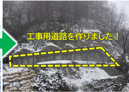
令和3年11月(施工完了)

本格的な積雪になる前に施工完了する事が出来ました。事故防止対策として転落、墜落、熱中症の 注意喚起オリジナルのぼり旗 を製作・設置し安全に務めました。