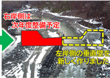
令和3年12月(施工完了)

今回の工事は、上流に3つの川があり、大雨になると一気に増水するため、洪水に強い仮締切計画に苦労しましたが、無事に工事を完了する事が出来ました。