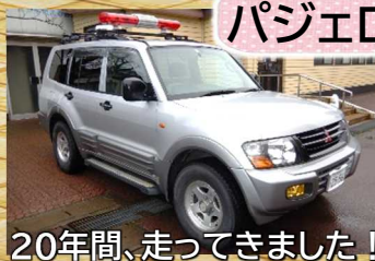
20年間、走ってきました！