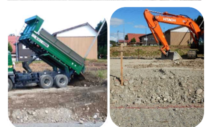
戸沢村の古口小学校跡地へ提供