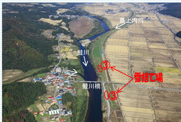
鮭川村大字佐渡地内