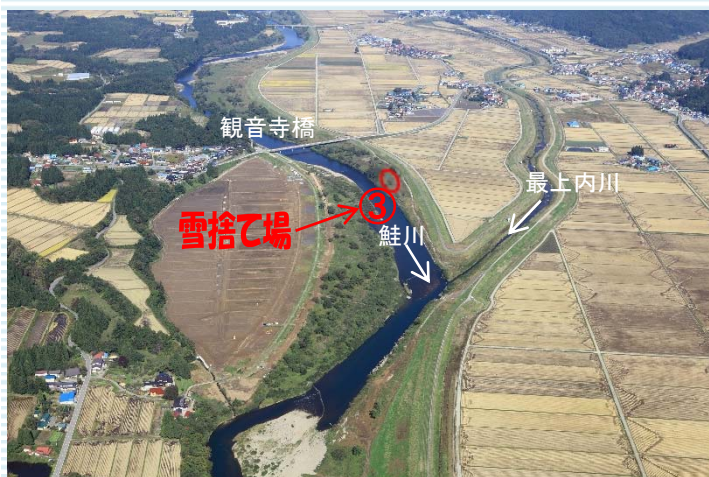
鮭川村大字庭月地内