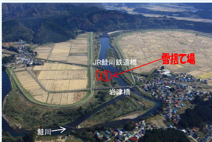
戸沢村大字岩清水地内

今年度も鮭川・真室川の河川敷を雪捨て場として関係市町村へ提供しています。 なお、ご利用される方は、雪捨て場に雪以外(ゴミなど)のものを持ち込まないようお願いいたします。