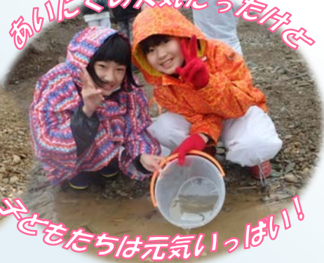
子どもたちは元気いっぱい!