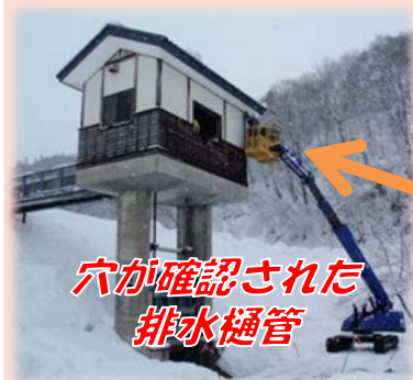
穴が確認された排水樋管

今後、効果の検証を行い、 治水上重要な施設の適切な維持管理 をすすめてまいります。