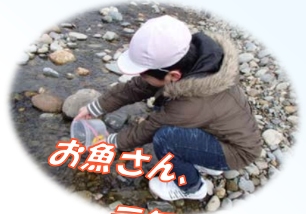
お魚さん、元気でねー!