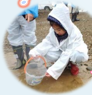
あいにくの天気だったけど