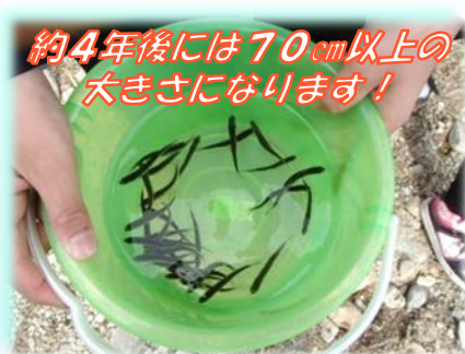
約4年後には70cm以上の大きさになります!

放流の際、児童たちは「頑張って泳いでね」「東京の川にも遊びに来てね」と声をかけ、下流に向かって泳いでいく鮭を暫く眺めていました。