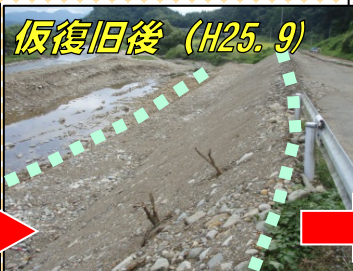
仮復旧後 (H25. 9)