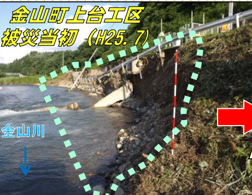
金山町上台工区 被災当初 (H25. 7)