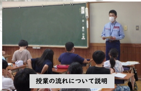
授業の流れについて説明

水災害から身を守る知識を普及させるため、新庄河川事務所では防災教育に係わる支援に取り組んでいます。9月11日(月)に真室川小学校4年生を対象としたマイ・タイムライン作成の防災学習支援を行いました。水害時にどのように行動するかを見童自ら考え、同じ地域の班員と話し合い、避難行動計画を作成しました。