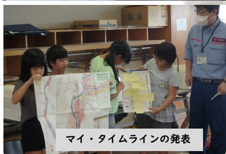
マイ・タイムラインの発表