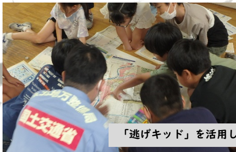
「逃げキッド」を活用し、防災行動を話し合います