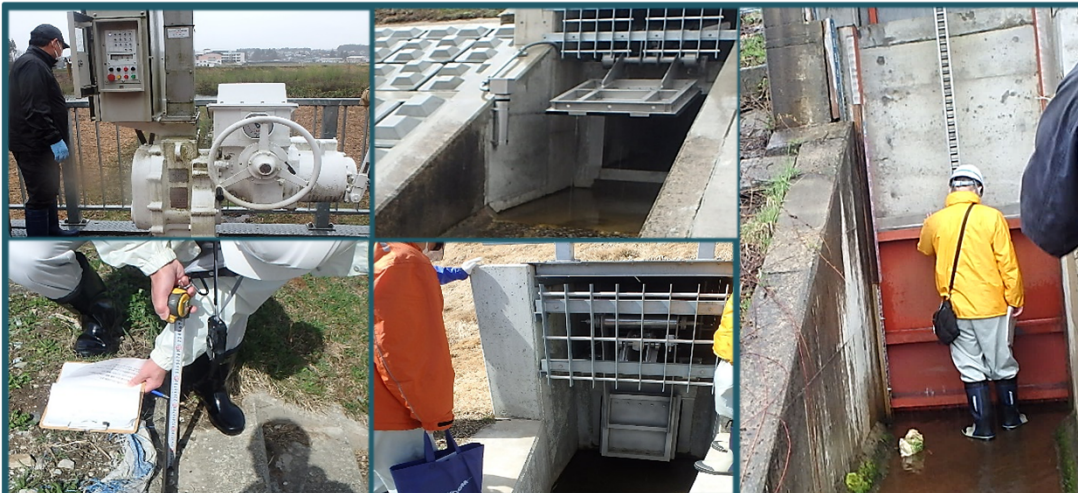
* 点検場所 *

戸沢村津谷から金山町山崎までの堤防の除草・養生等の河川維持管理を行います。当工事は豪雨に伴う河川の増水等の緊急時の対応・作業等もありますので、地域の皆様のご理解とご協力を賜りながら、きれいな川を守っていただけるよう頑張っております。