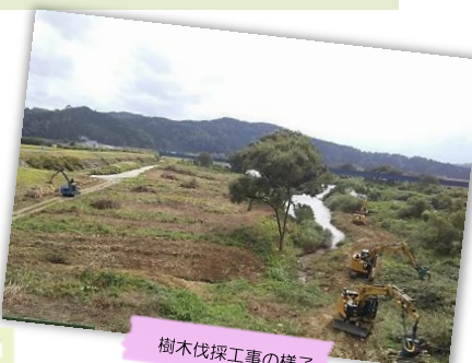
樹木伐採工事の様子