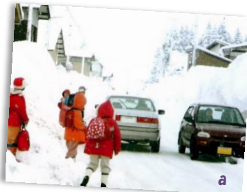
a-堆積した雪のため危険な通学路