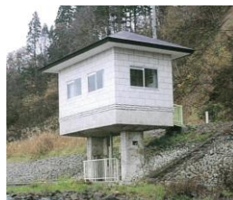
金山川導水樋管 (消流雪取水口)