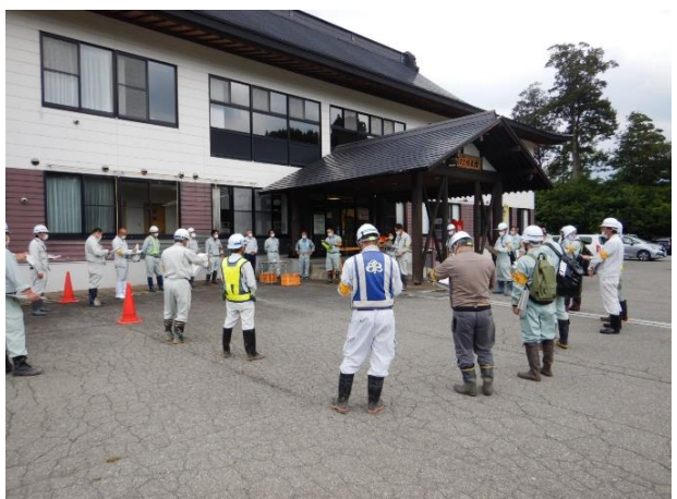
場所：ふるさと味来館(大蔵村) 安全パトロールを行う前に、現場担当者から工事概要の説明をしているところです。

8月21日(金)に、「第1回新庄地区安全パトロール」が行われました。安全パトロールは年に二回新庄河川事務所事故防止対策委員会新庄地区(新庄河川事務所・銅山砂防出張所・鳥越出張所・鮭川出張所・工事受注者・調査受注者)が実施しています。第1回目は、「銅山川流域豊牧砂防堰堤流木止め設置ほか工事」「銅山川流域横道赤砂第一砂防堰堤工事」の二箇所の工事現場を点検しました。 (※二回目の新庄地区安全パトロールは10月に予定しています。)