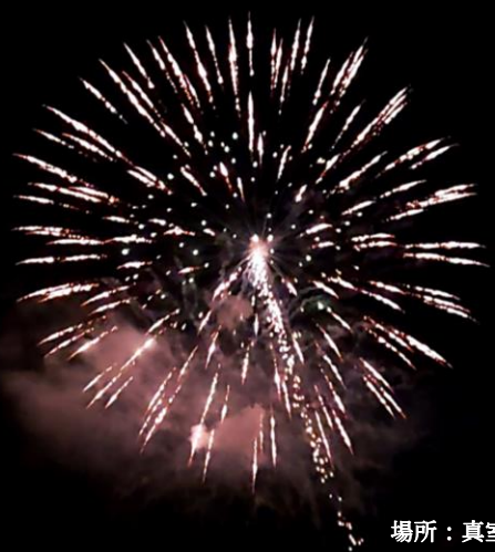
場所：真室川河川敷

秋田県大仙市の団体が中心となり設立した「日本の花火を愛する会」の主催で8月22日(土)に全国28都県・計66カ所にて各地で一斉に花火が打ち上げられ、山形県では真室川の河川敷で約50発の花火が夜空を彩りました。この日本の花火「エール」プロジェクトは、新型コロナウイルスの影響で全国的に花火大会の中止が相次ぐ中、全国の花火業者ははじめ献身的な従事を行っている医療関係者への激励、新型コロナウイルスの影響で不自由な生活を続ける皆さんへ「エール」を送ろうと企画されたプロジェクトです。なお、三密を避けるため時間及び打ち上げ場所などの詳細の情報は非公開としています。後日、各地域で打ち上げられた花火の様子は動画で配信されます。