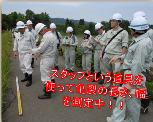
スタッフという道具を使って亀裂の長さ、幅を測定中！！

第3回鮭川出張所管内堤防モニタリング調査を実施しました。今回の調査は、若手職員を主体とした現場技術研修会を伏せて実施しました。モニタリング調査とは、堤防を歩きながら目視により変状などがないか点検する仕事です。(簡易な計測、触診、打音検査等も実施)