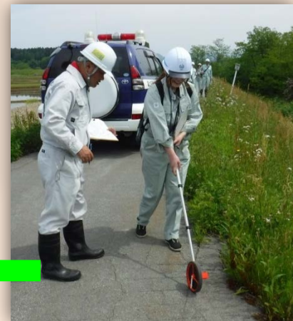
ロードカウンターという道具を使って距離を測っているよ！