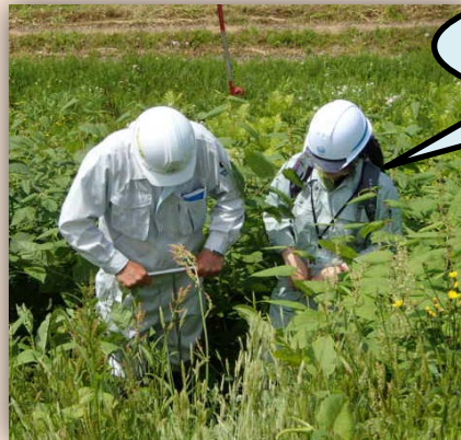
貫入棒を突き刺して土の柔らかさを確認中！