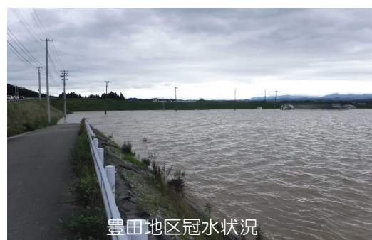
豊田地区冠水状況