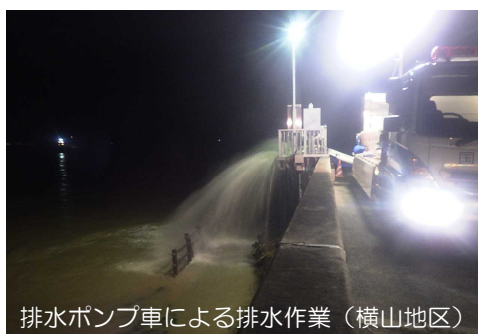
排水ポンプ車による排水作業（横山地区）