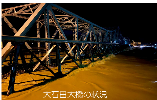
大石田大橋の状況

今回の豪雨で被災された皆様に心よりお見舞い申し上げますとともに、危険な中、昼夜を問わず作業にあられた水防団や水位観測員、関係業者の皆様に感謝申し上げます。