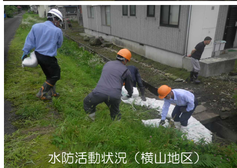
水防活動状況（横山地区）