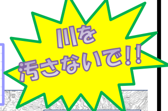
H26~30年度 大石田出張所管内投棄箇所マップ 代表的な投棄物のみ写真掲載

H26~30年度に、大石田出張所管内で発見された不法投棄マップをまとめました。 一人一人の心掛けで美しい川を守りましょう。