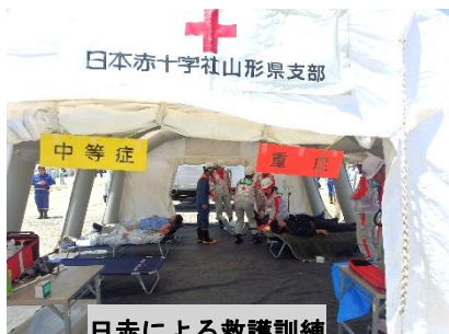
日赤による救護訓練