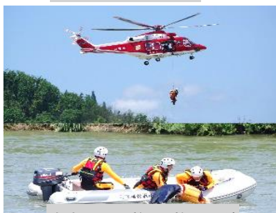
消防による救助・救出訓練