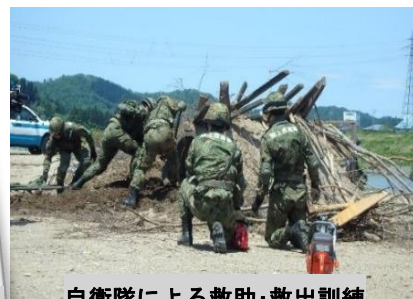
自衛隊による救助・救出訓練