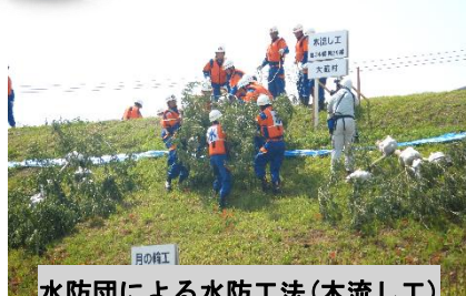
水防団による水防工法(木流し工)

5月27日に、大石田町横山地内で19年ぶりとなる「最上川総合水防演習」が行われました。当日は、秋元国土交通政務官をはじめ山形県副知事や地元大石田町長にご参加頂くとともに、来賓として衆議院議員の鈴木議員、遠藤議員及び加藤議員にも出席頂き、演習参加者や一般見学者を合わせて約1,700名の大規模な演習となりました。