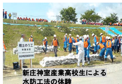
新庄神室産業高校生による水防工法の体験