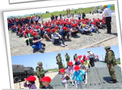
住民による避難訓練(小学生・住民等)