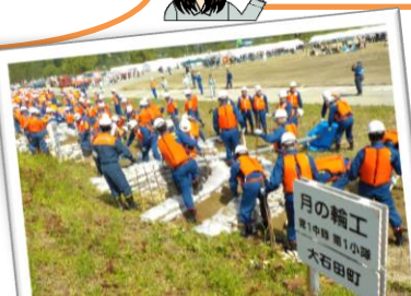
水防団による水防工法(月の輪工)