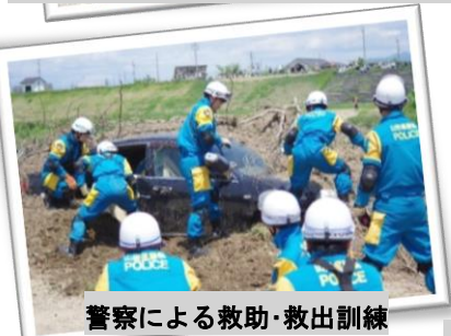
警察による救助・救出訓練