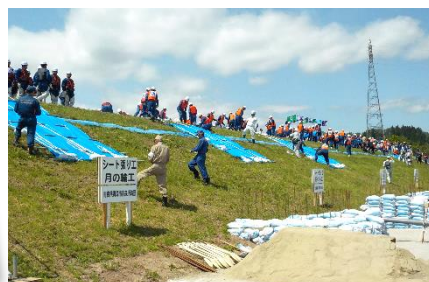
各県代表の水防団による水防技術競技大会

地域住民の皆さまや関係機関の方々のおかげで無事に最上川総合水防演習を行うことができました。ご協力、ありがとうございましたm(_ _)m