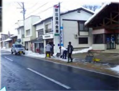
流雪溝への 投雪作業状況