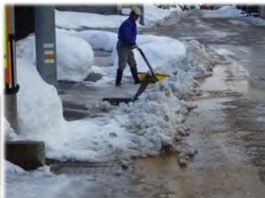
重機除雪後の後片付けに 流雪溝を活用中