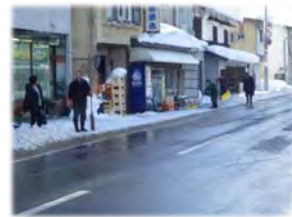
流雪溝への 投雪作業状況