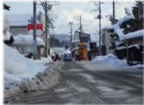
重機での除雪状況

1月中旬の大雪で、大石田町に豪雪対策本部が設置されました。このため、大石田・横山・岩ヶ袋の各流雪溝の利用時間を延長し、対応しました！