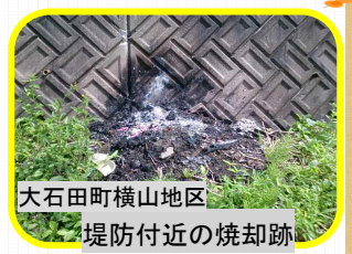
大石田町横山地区 堤防付近の焼却跡