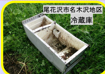
尾花沢市名木沢地区 冷蔵庫

不法投棄は「河川法」及び「廃棄物の処理及び清掃に関する法律」に違反する行為です！！