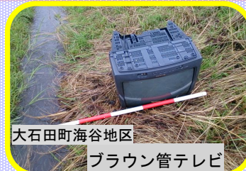
大石田町海谷地区 ブラウン管テレビ