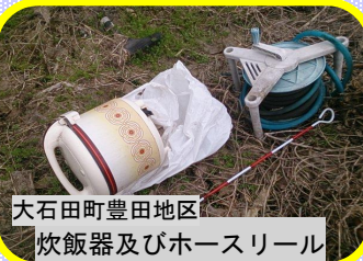
大石田町豊田地区 炊飯器及びホースリール