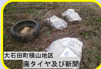
大石田町横山地区 廃タイヤ及び新聞

不法投棄は「河川法」及び「廃棄物の処理及び清掃に関する法律」に違反する行為です！！