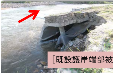
[既設護岸端部被災箇所 着工前]