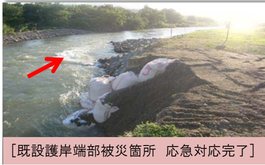
[既設護岸端部被災箇所 応急対応完了]