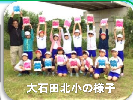
大石田北小の様子