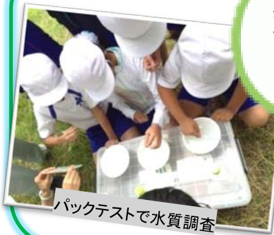
パケットテストで水質調査

今回試したのは・・・ 丹生川の水: 中性(緑) せっけん水: アルカリ性(青) レモン水: 酸性(オレンジ) 丹生川の水は 緑色に染まったね!