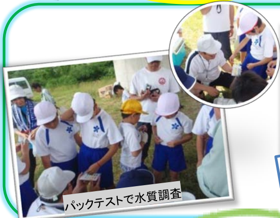
パケットテストで水質調査