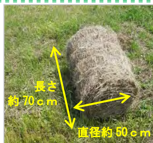
提供する刈草のイメージ

申込方法につきましては、あらためて広報紙等でお知らせします。【問合せ先:大石田出張所 電話0237(35)2024】