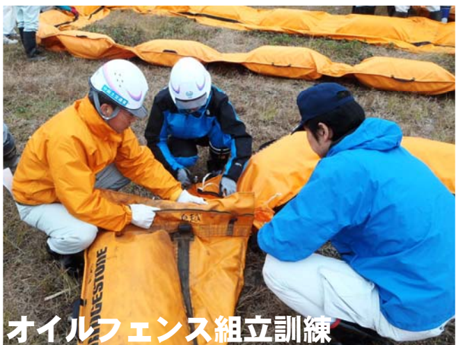
オイルフェンス組立訓練

当日は、国土交通省・県・最上川流域の市町村など関係者約100名が参加。万が一の油事故の際に迅速な対応ができるよう、各種技術の習得・訓練を行いました。