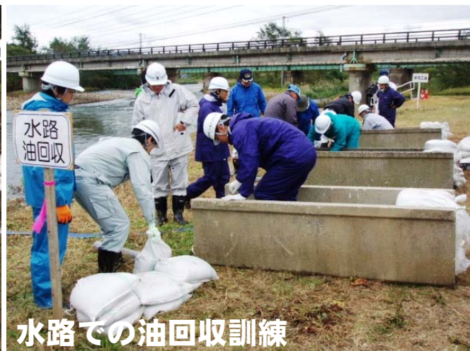
水路での油回収訓練

■ 横断工法 ・・・河川に流出した油類の拡散を防ぐことを目的とした工法。設置するには、流速が遅く、川幅が狭い箇所等の条件があります。