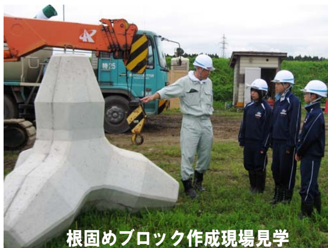
根固めブロック作成現場見学