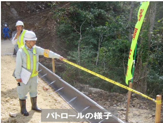
パトロールの様子