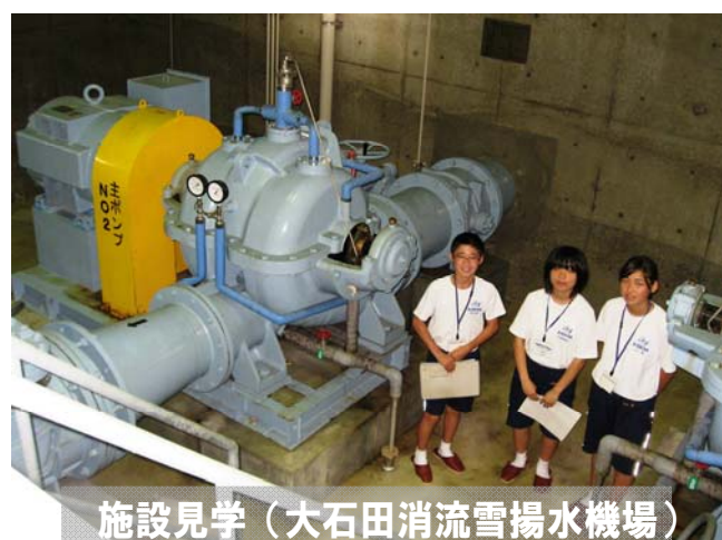
施設見学(大石田消流雪揚水機場)