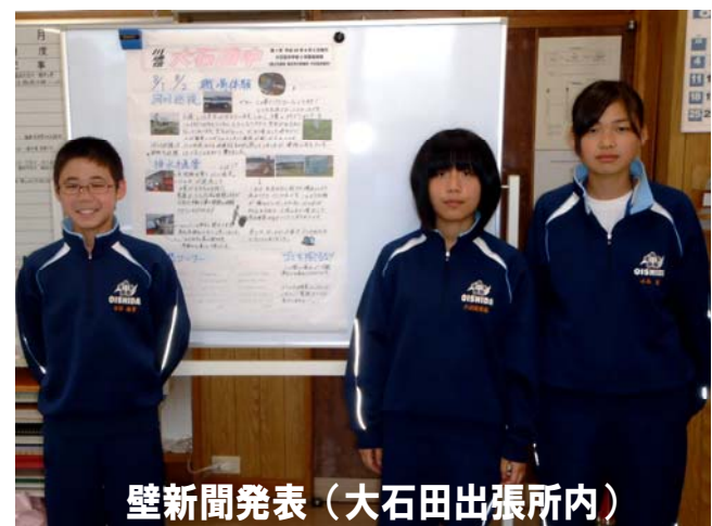
壁新聞発表(大石田出張所内)