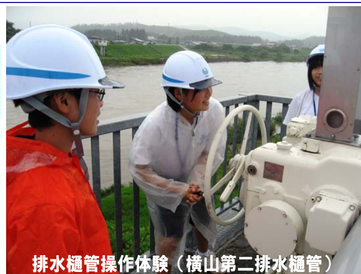
排水樋管操作体験(横山第二排水樋管)

生徒達は、洪水などの災害から地域を守る出張所の仕事を実際に堤防を歩いたり、河川施設を見学したりしながら体験しました。