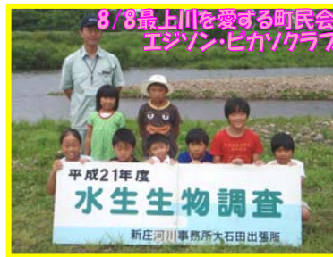
8/8最上川を愛する町民会議 エンジンピカソクラブ