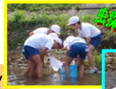
虫探しにみんな真剣!!!

調査の結果、最上川、丹生川ともに『少し汚れた水』でした。みんなも少し残念な様子でしたが、これを機会に一人一人が川への関心を高め、きれいな最上川を取り戻していきましょう!!!