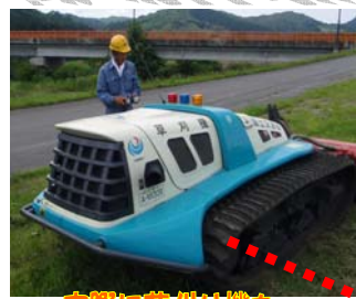
実際に草刈り機を操作中☆

8/5に大石田第一中学校、3名の生徒さんが当出張所で職場体験学習をしました。管内にある施設をパトロールしながら役割の説明を聞き、見学・点検を行いました。災害対策ステーションではポンプ車のホースを実際に持ってみて、想像以上の重さにビックリしていました(◎-◎)!!!