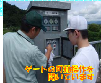
ゲートの可動操作を聞いています