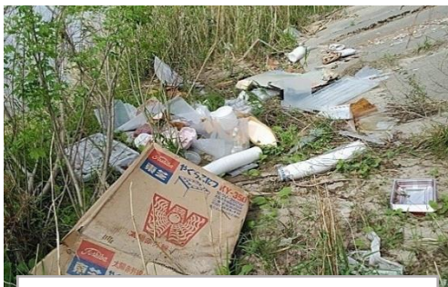
名木沢地区(護岸) R6.10月 家庭ゴミ(粗大ゴミ)投棄