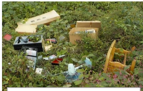
豊田地区(高水敷) R6.10月 家庭ゴミ(粗大ゴミ)投棄

大石田出張所では河川パトロールを行い、不法投棄の箇所や投棄物などを厳しくチェックしていますが、通行者が少なく人目につきにくい場所に悪質な不法投棄が多く見られます。