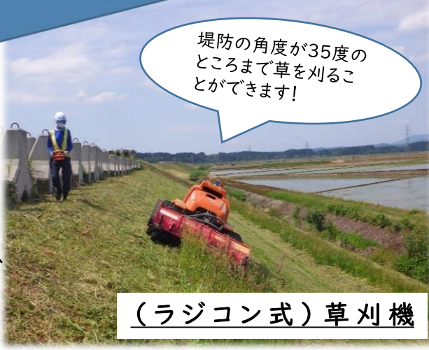
(ラジコン式) 草刈機

除草作業は、みなさまのご迷惑にならないよう配慮して進めてまいりますので、ご理解とご協力をお願いします。