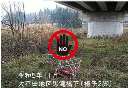
令和5年11月 大石田地区黒滝橋下(椅子2脚)