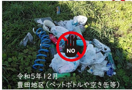
令和5年12月 豊田地区(ペットボトルや空き缶等)