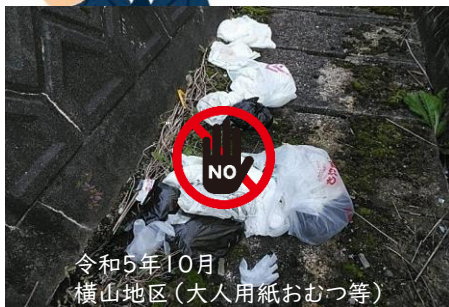
令和5年10月 横山地区(大人用紙おむつ等)