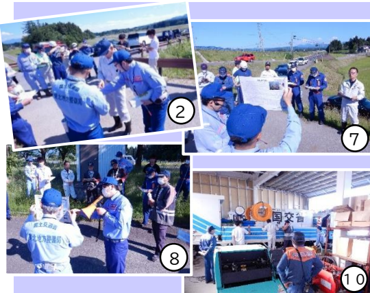
それぞれの現地で水防箇所の説明をしていきました。